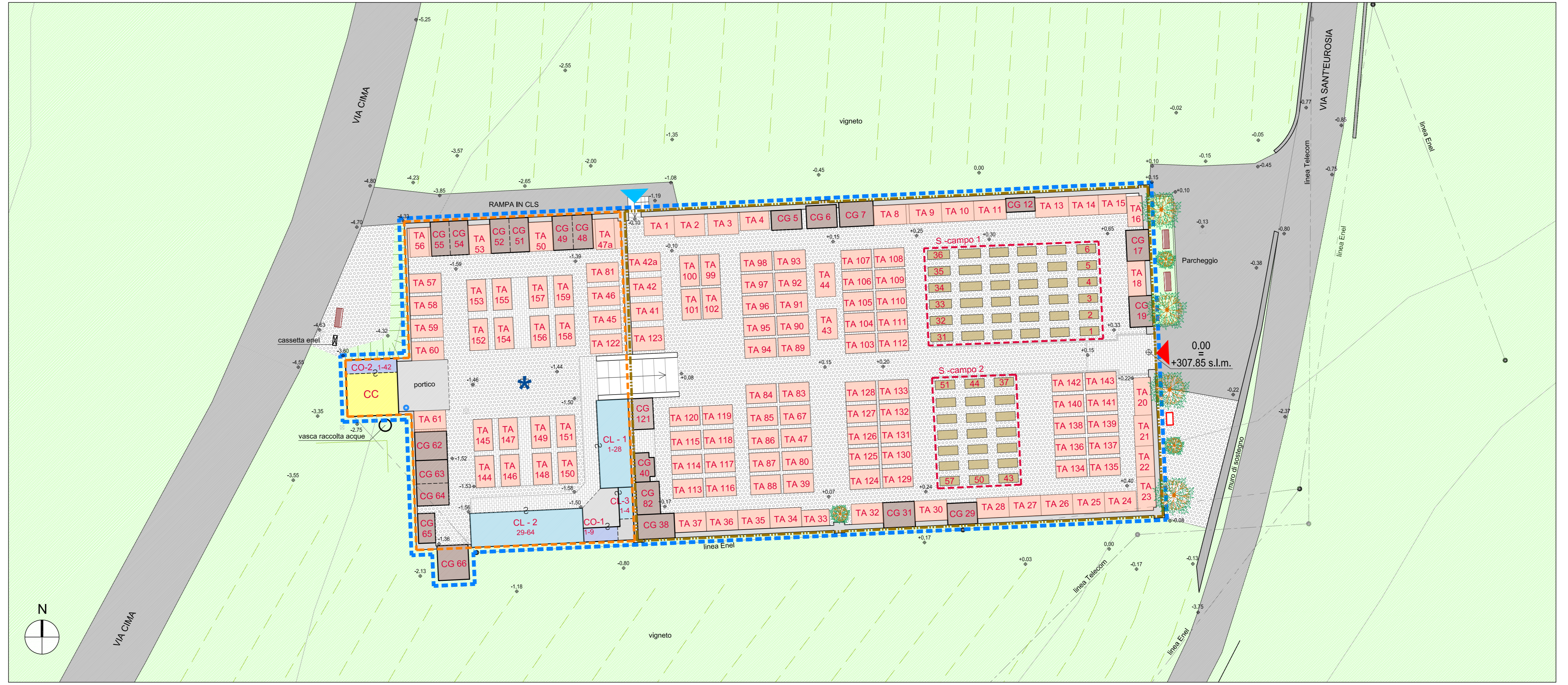
PLANIMETRIA STATO DI FATTO - scala 1:200