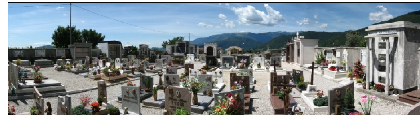
VISTA INTERNA DEL CIMITERO