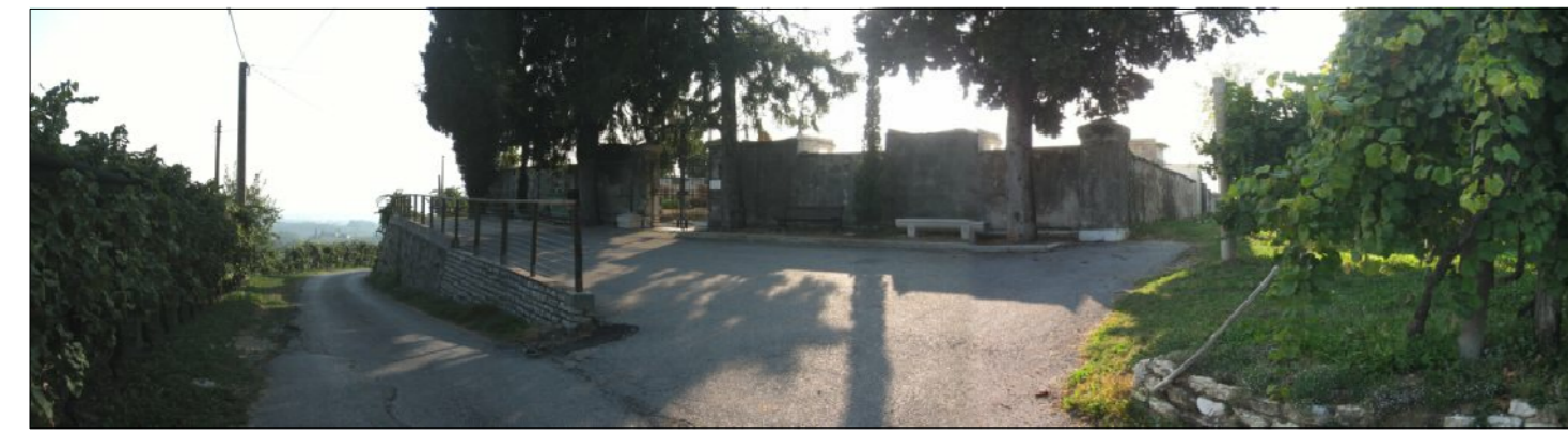
VISTA ESTERNA DEL CIMITERO